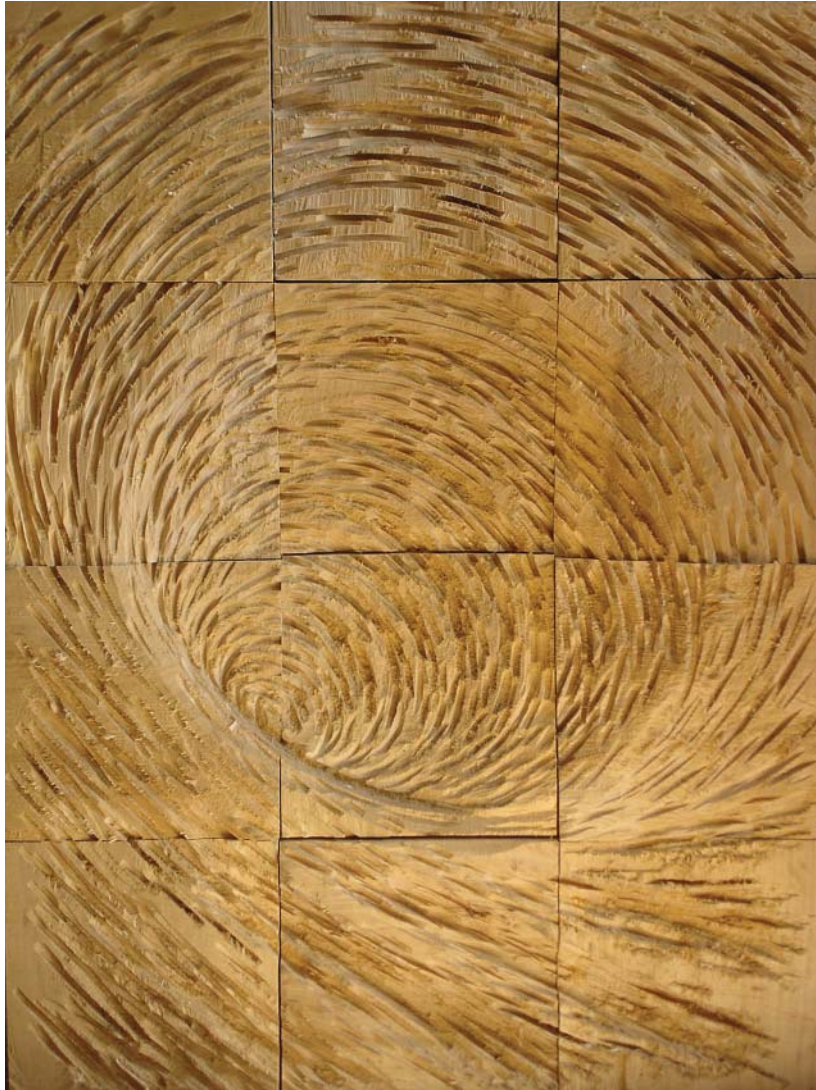
„Strudel“ Ernst Groß Pappel, 102x76x9 cm, 2009