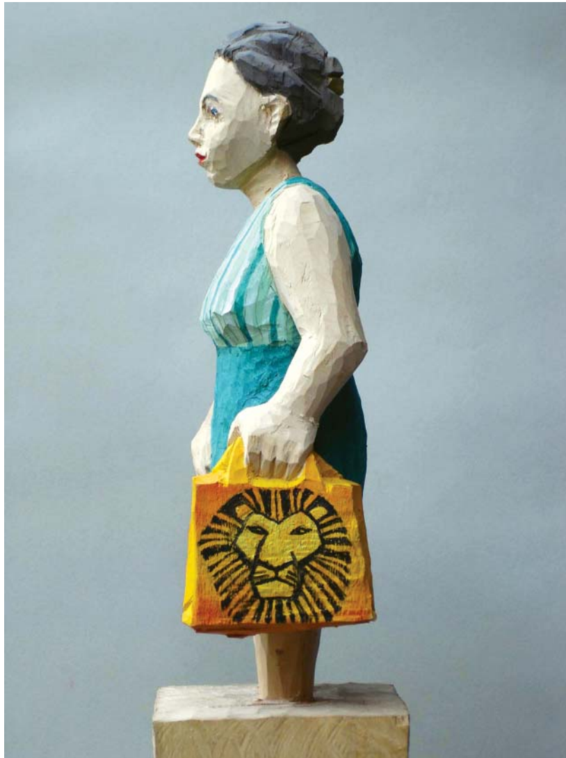
„Edekafrauen“ Kristina Fiand Linde und Acryl, 48x11x11 cm, 2009