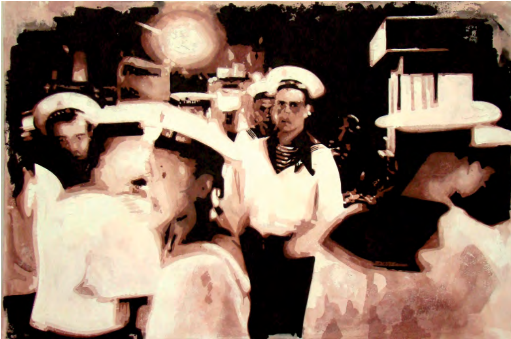
„Flashback 021“ | Öl und Acryl auf Leinwand, 100x150 cm, 2010