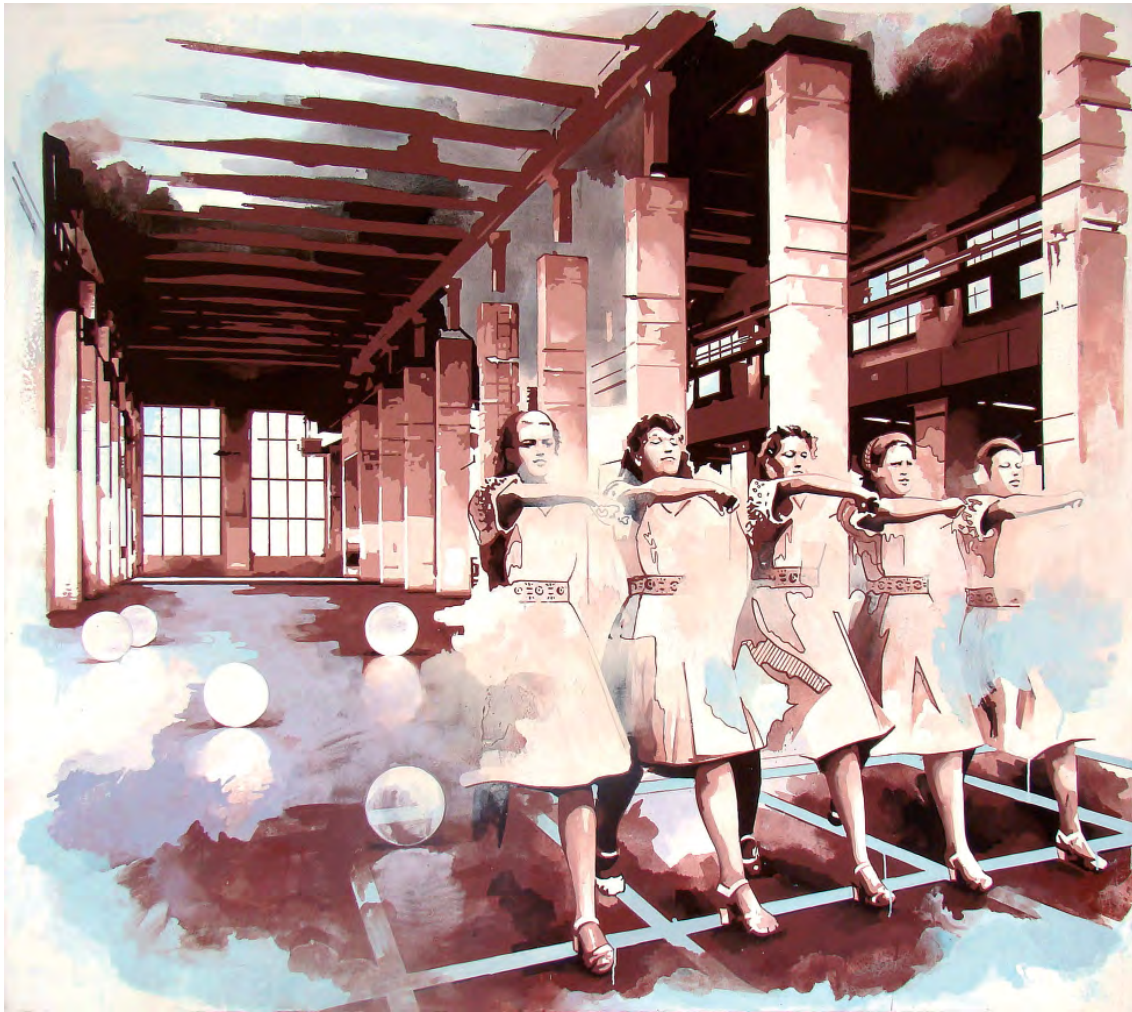
„Flashback 008“ | Öl und Acryl auf Leinwand, 170x190 cm, 2010