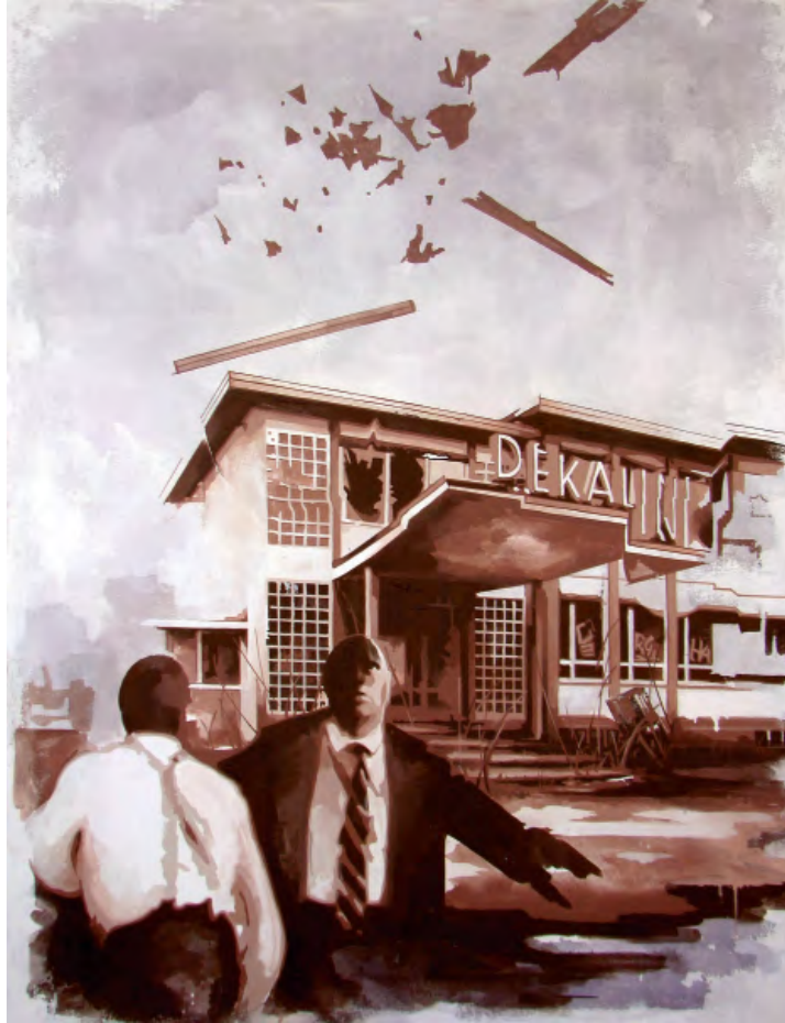
„Flashback 003“ | Öl und Acryl auf Leinwand, 180 × 140 cm, 2010