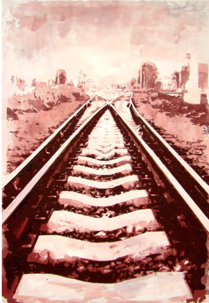
„Flashback 022“ | Öl und Acryl auf Leinwand, 160x110 cm, 2010