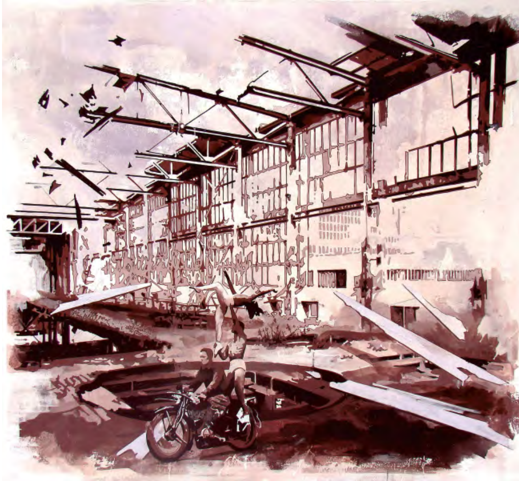
„Flashback 005“ | Öl und Acryl auf Leinwand, 150×165 cm, 2010