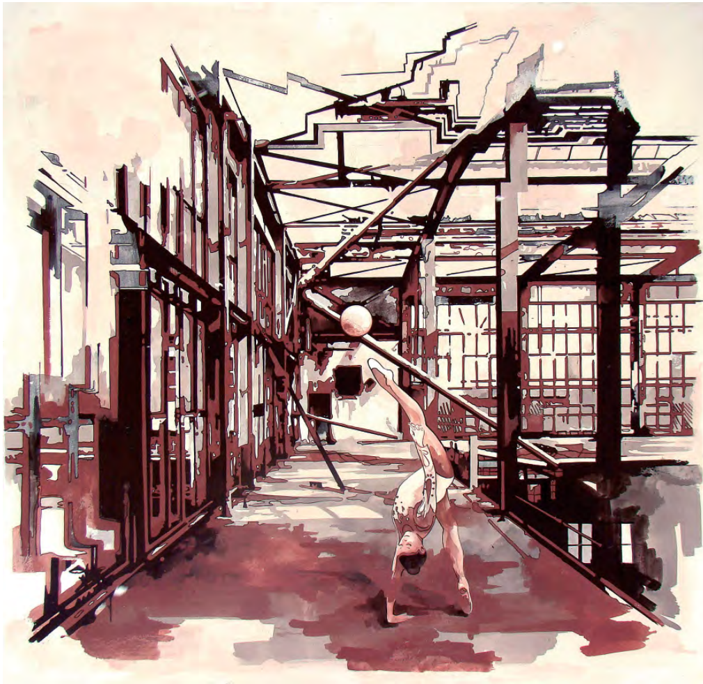
„Flashback 012“ | Öl und Acryl auf Leinwand, 150x155 cm, 2010