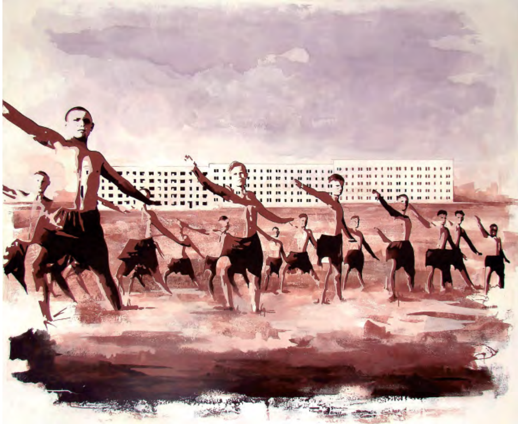
„Flashback 011“ | Öl und Acryl auf Leinwand, 150x165 cm, 2010