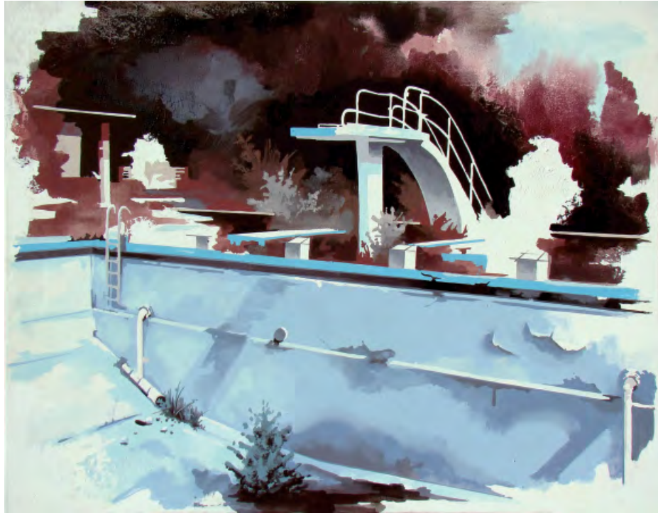
„Flashback 005“ | Öl und Acryl auf Leinwand, 85x110 cm, 2010