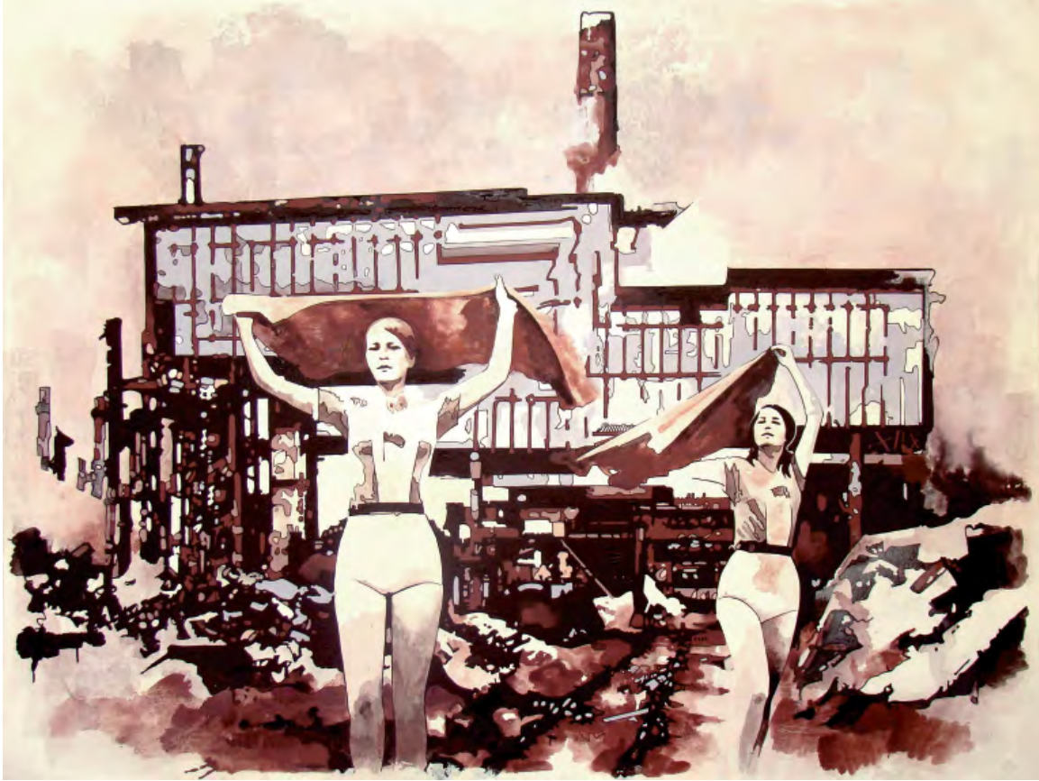
„Flashback 013“ | Öl und Acryl auf Leinwand, 150x200cm, 2010