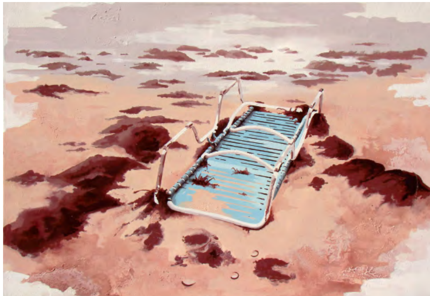
„Flashback 010“ | Öl und Acryl auf Leinwand, 70x90cm, 2010