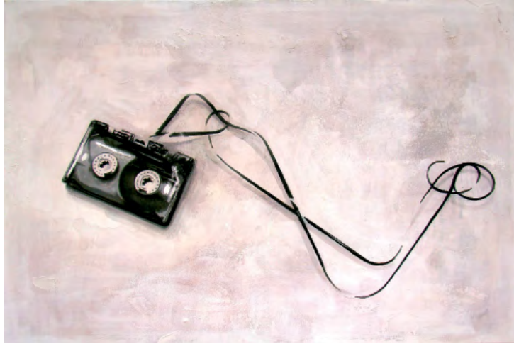
„Flashback 020“ | Öl und Acryl auf Leinwand, 95x140 cm, 2009