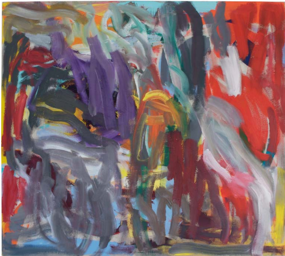
„rote Ecke“ Öl auf Leinen, 170x190 cm, 2009