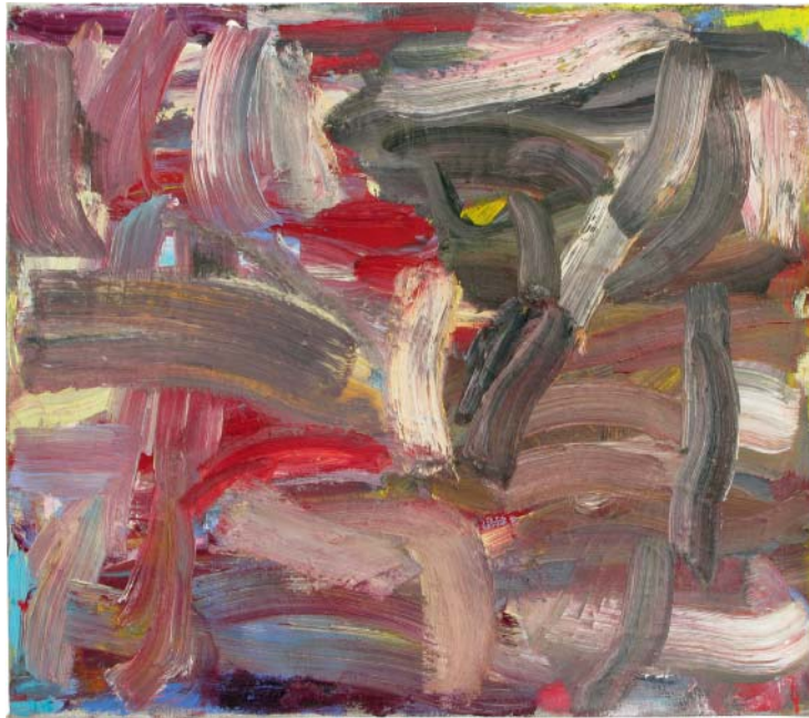
„teardrops“ Öl auf Leinen, 70x80 cm, 2009