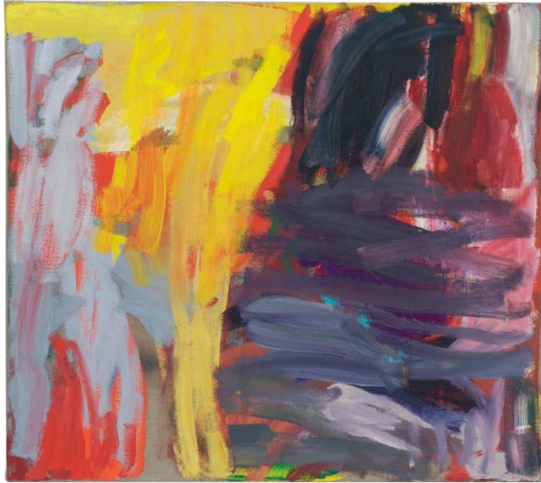
„gelber Regen“ Öl auf Leinen, 70x80 cm, 2009