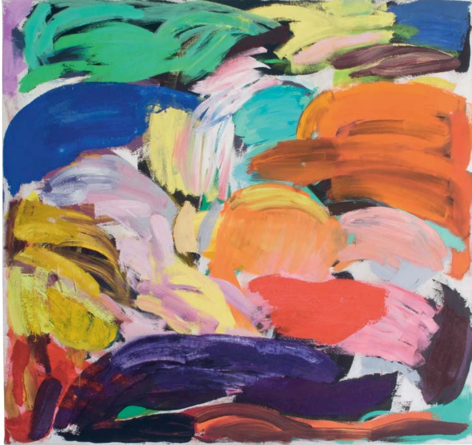
„Bavarian song“ Öl auf Leinen, 150x160cm, 2008