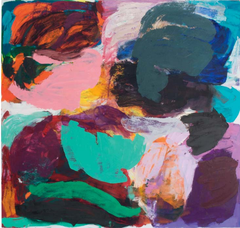
„die 4. Dimension“ Öl auf Leinen, 160x170cm, 2008