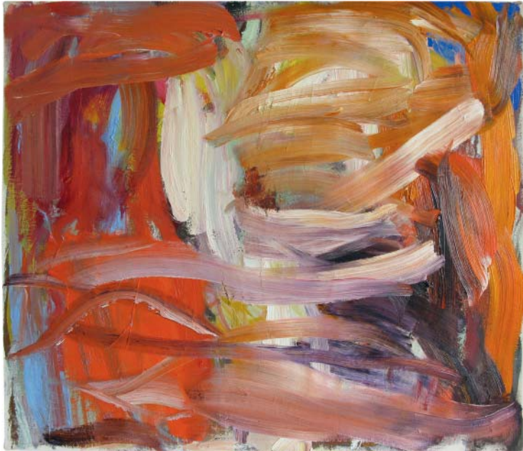
„click!“ Öl auf Leinen, 70x80cm, 2009