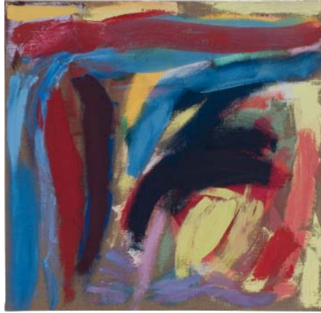
„Wunsch 7“ Öl auf Leinen, 63x66 cm, 2009