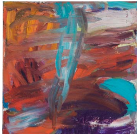
„kristallblau“ Öl auf Leinen, 60x60 cm, 2009