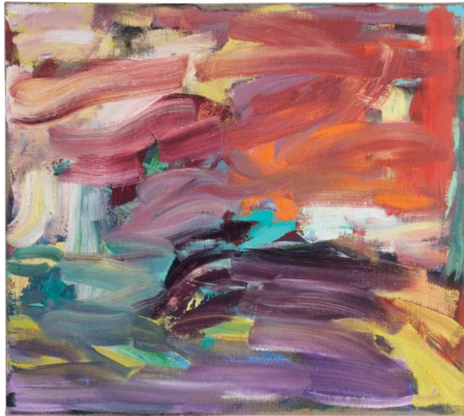
„Urfeld“ Öl auf Leinen, 70x80 cm, 2009