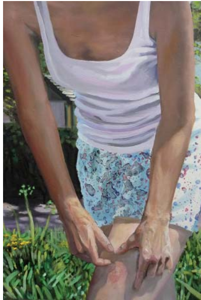
„Mückenstich“ | Acryl, Öl und Lack auf Leinwand, 80x55 cm, 2009