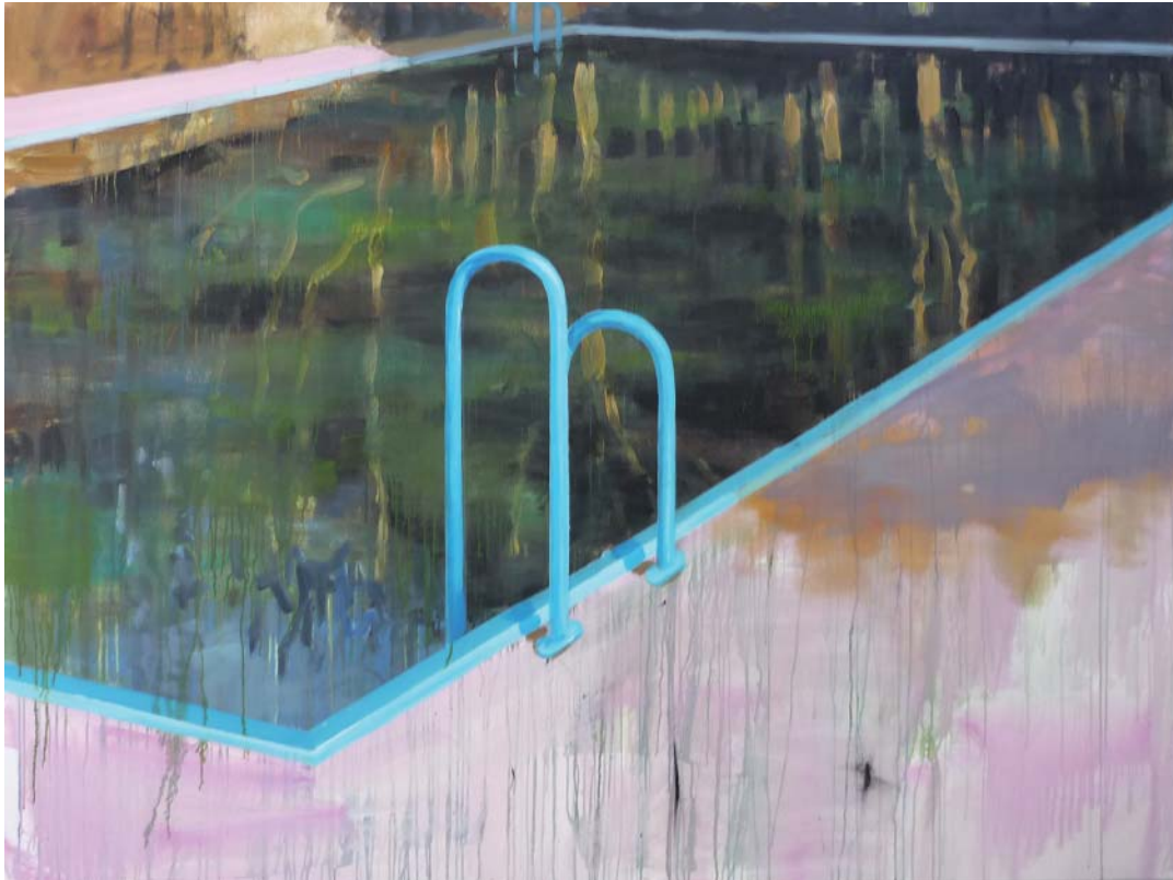
„Schwimmbecken im Wald“ | Acryl, Öl und Lack auf Leinwand, 150 x 200 cm, 2009