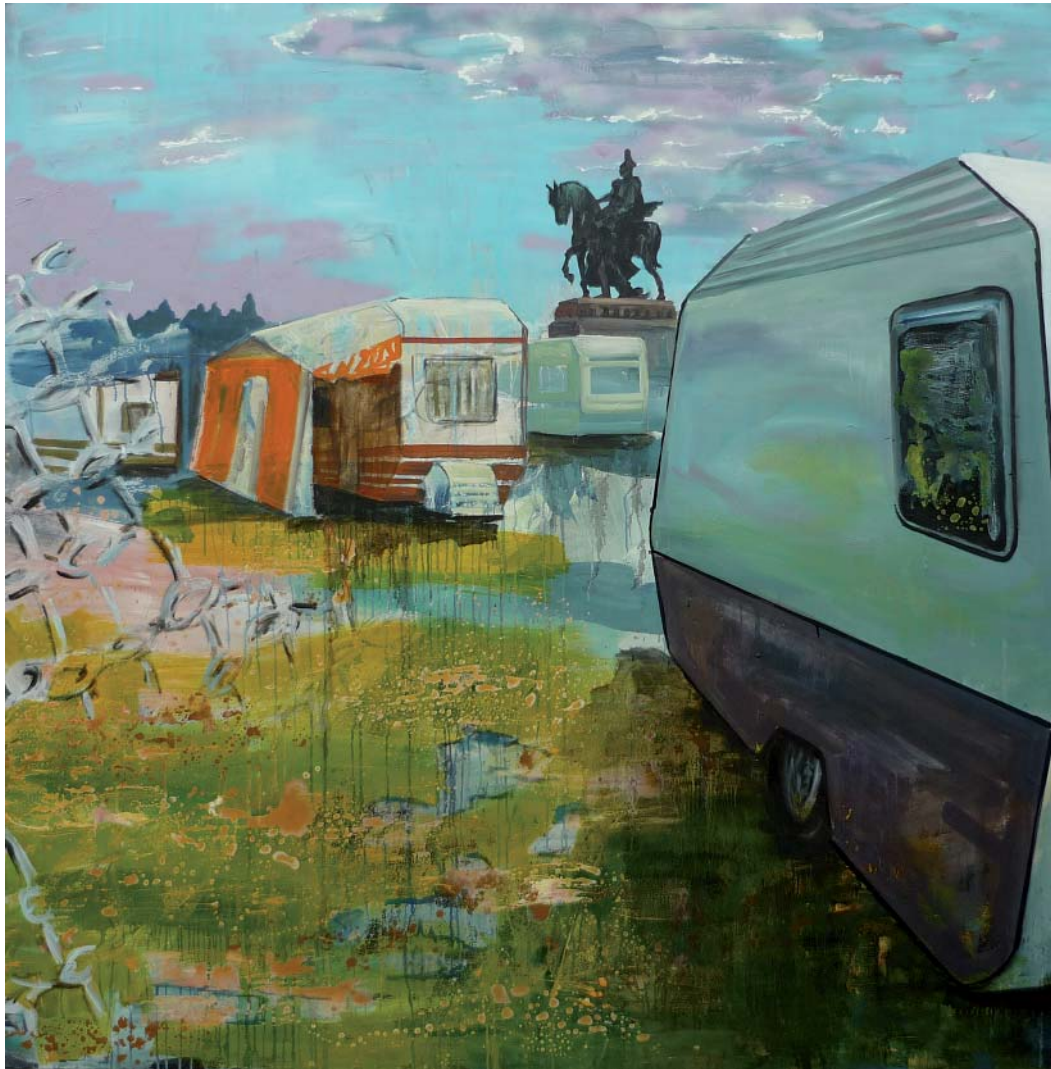
„Deutsches Eck“ | Acryl, Öl und Lack auf Leinwand, 200x195 cm, 2009