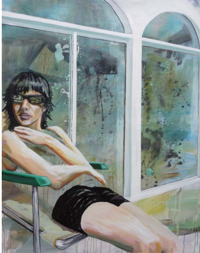
„Sonnenbad vor Fensterfront“ | Acryl, Öl und Lack auf Leinwand, 160x125 cm, 2009