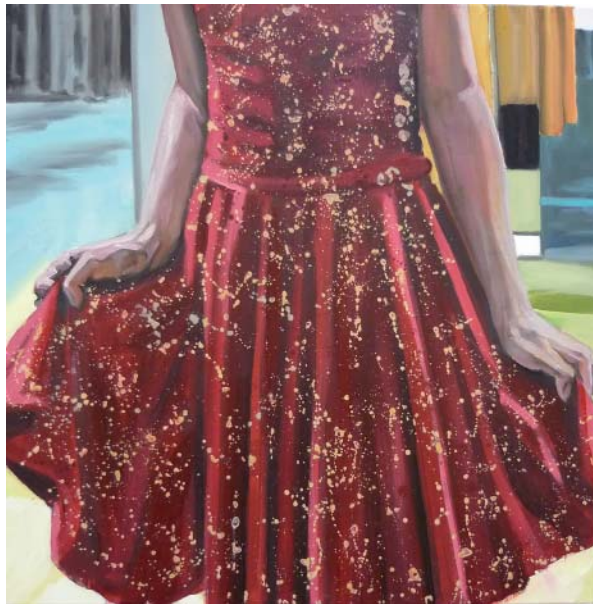
„Rotes Kleid“ | Acryl, Öl und Lack auf Leinwand, 100x100 cm, 2009