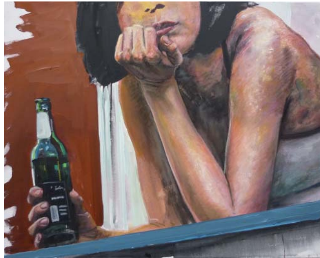
„Fensterblick mit Bier“ | Acryl und Ölkreide auf Leinwand, 80x100 cm, 2010