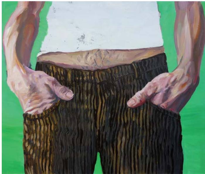
„Cordhose“ | Acryl, Öl und Lack auf Leinwand, 110x130 cm, 2009