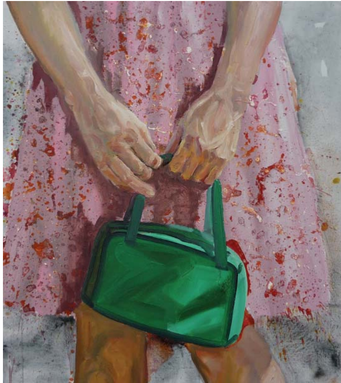
„Grüne Handtasche“ | Acryl, Öl und Lack auf Leinwand, 90x80 cm, 2009