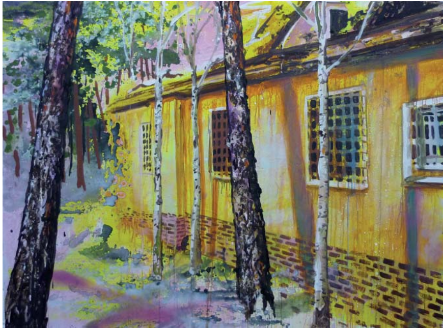
„Gelbes Haus“ | Acryl, Öl und Lack auf Leinwand, 120 x 160 cm, 2009