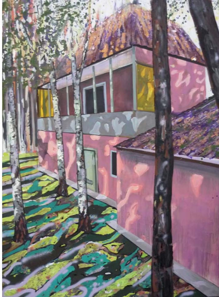
„Haus mit Veranda“ | Acryl, Öl und Lack auf Leinwand, 180x135 cm, 2009