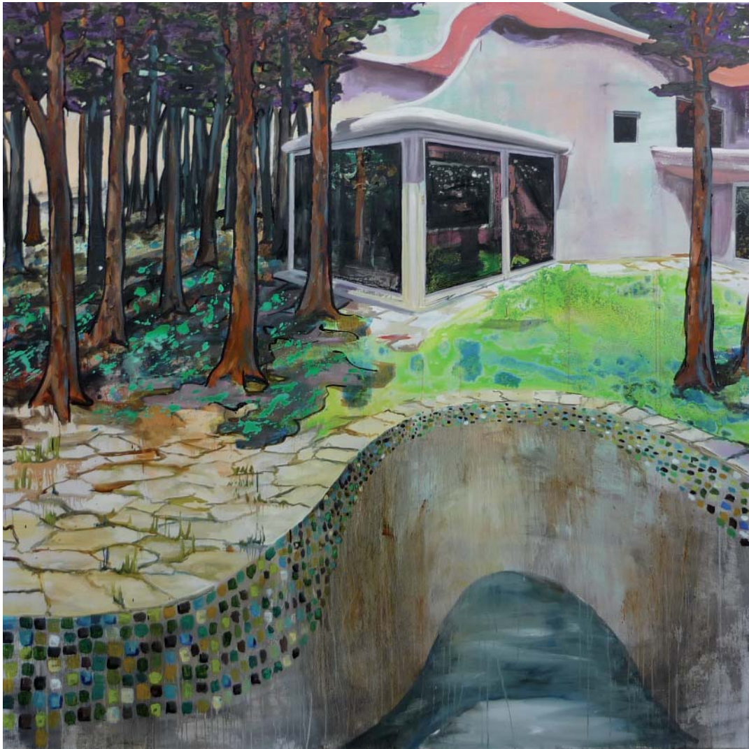
„Villa mit Becken“ | Acryl, Öl und Lack auf Leinwand, 200 x 200 cm, 2009