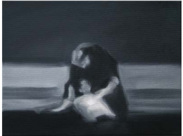
Contemplation | 30x40cm, 2008