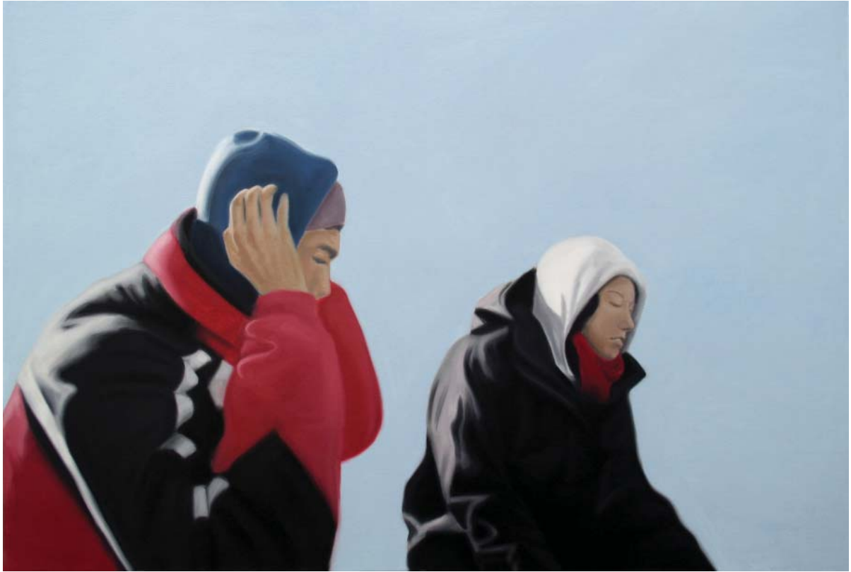
Bright Light | 100x150cm, 2009