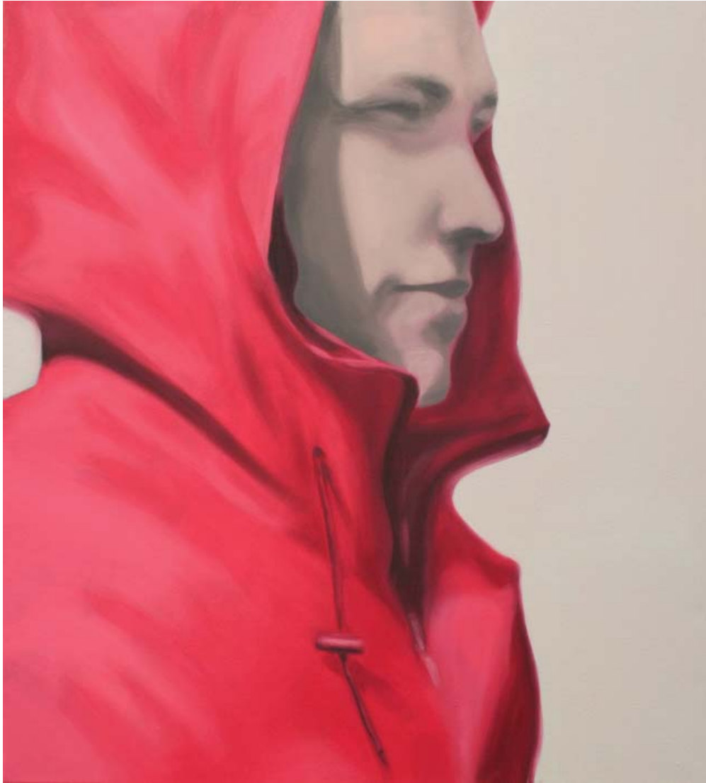
„I“ | 100x90cm, 2009