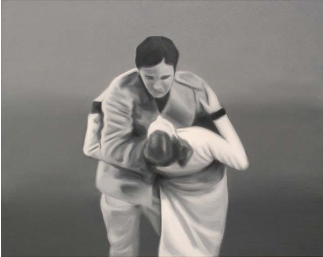
Allurement | 100x125cm, 2009