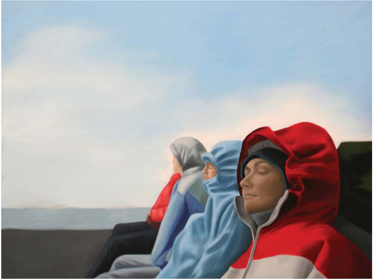
Exile | 120x160cm, 2008