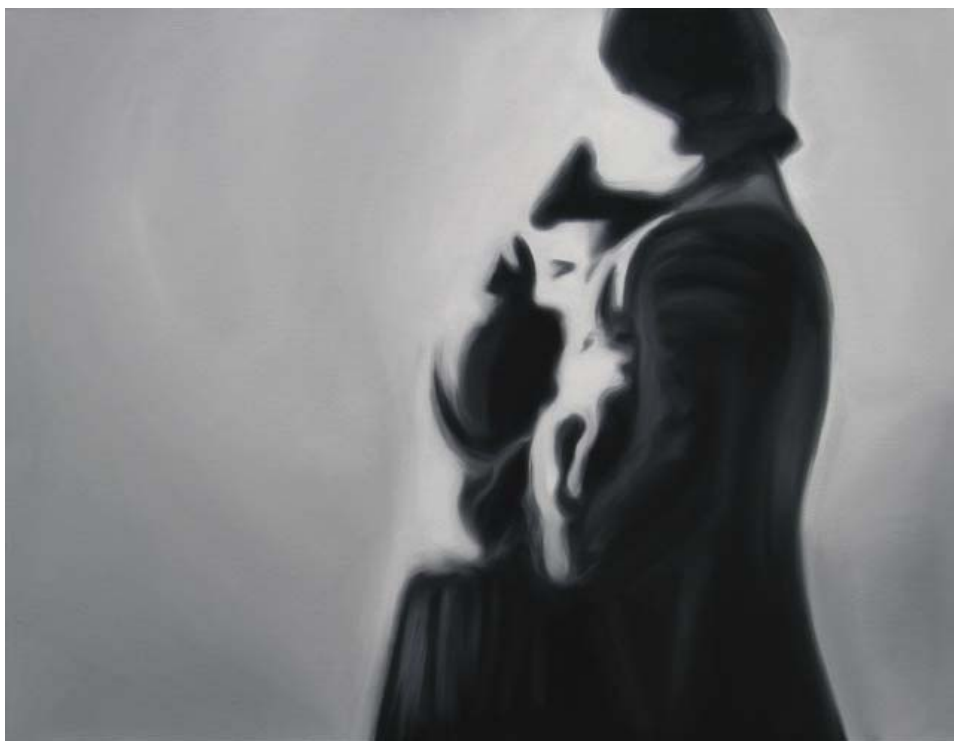
o.T. | 70x90cm, 2009