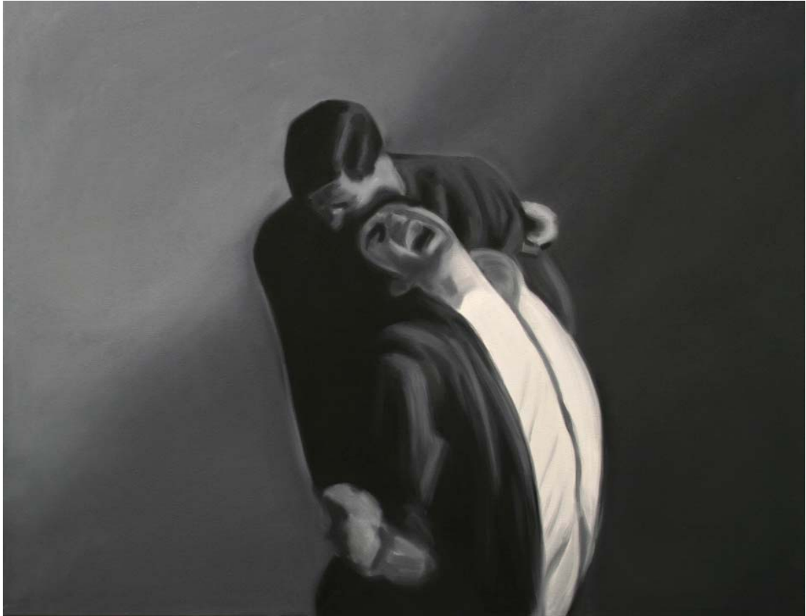
Downfall I | 100x130cm, 2008