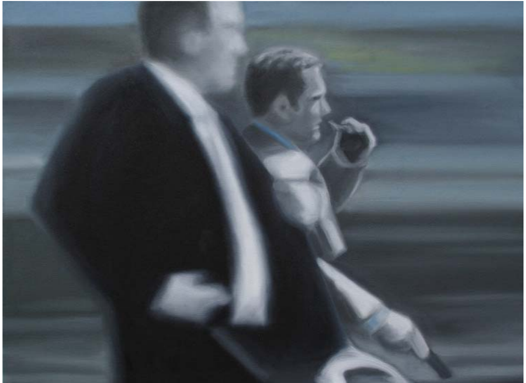
Out In The Streets (They Call It Murder) | 70x100cm, 2009