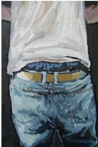
„The Sagging Pants“

Acryl und Acryllack auf Leinwand, 29x20 cm, 2011