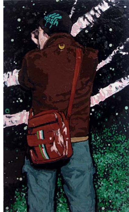
„Short Moment II“ Acryl und Acryllack auf Leinwand, 58x35 cm, 2008