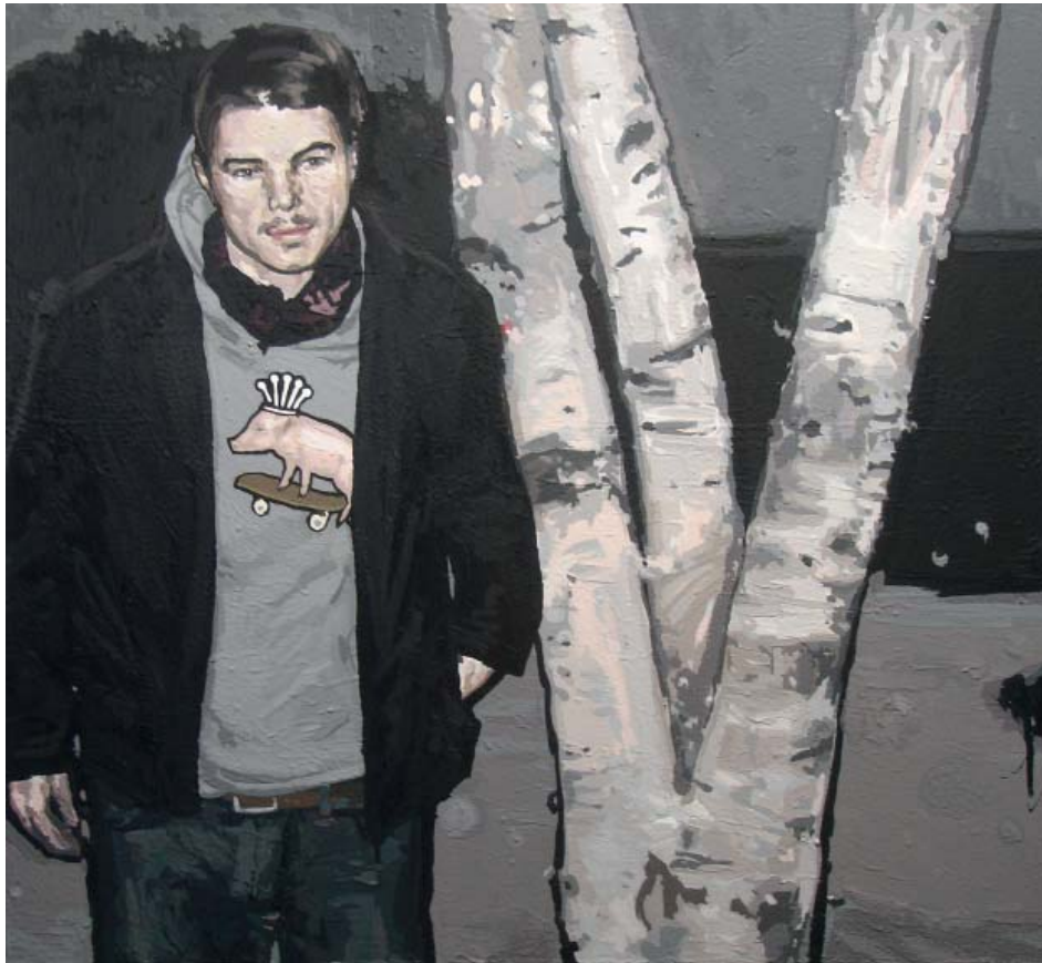
„Funky Pig I“ | Acryl und Acryllack auf Leinwand, 80x84cm, 2011