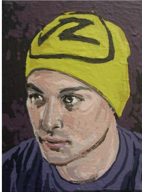
„Yellow Funk II“

Acryl und Acryllack auf Leinwand, 20x20 cm, 2011