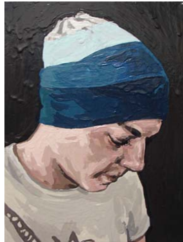
„Funky Things II“ Acryl und Acryllack auf Leinwand, 21×19cm, 2011