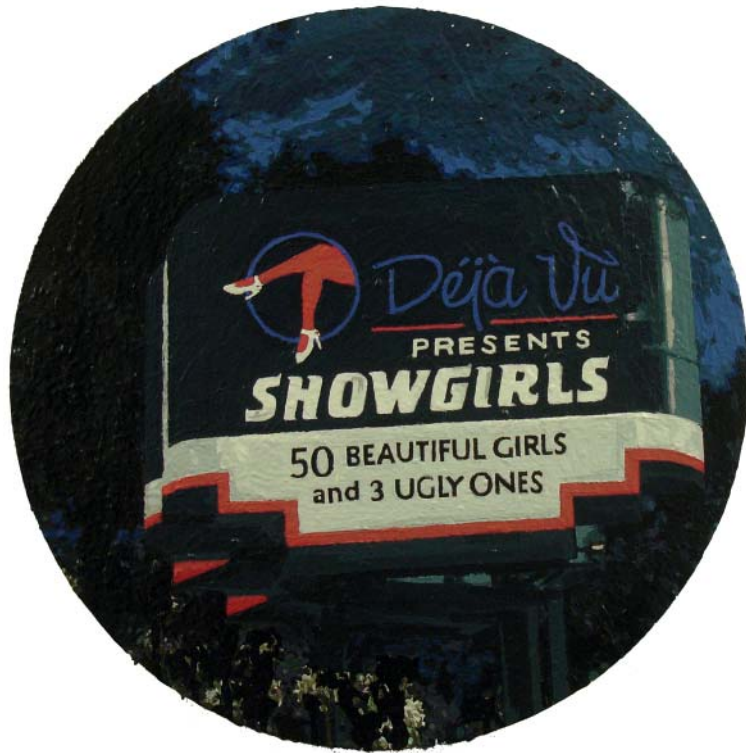
„Showgirls I“ | Acryl und Acryllack auf Leinwand, 60x60 cm, 2010