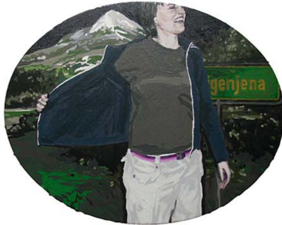
„Sternenklar II“ | Acryl und Acryllack auf Leinwand, 50x60 cm, 2008