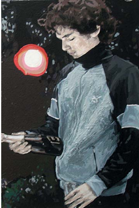
„Club III“ Acryl und Acryllack auf Leinwand, 58x39cm, 2010