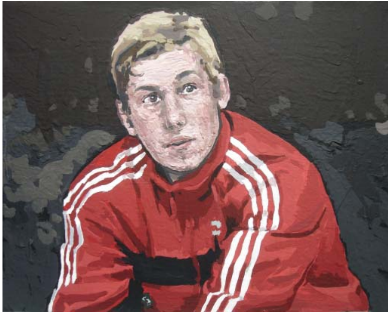
„Hardcore II“ | Acryl und Acryllack auf Leinwand, 31×38 cm, 2011