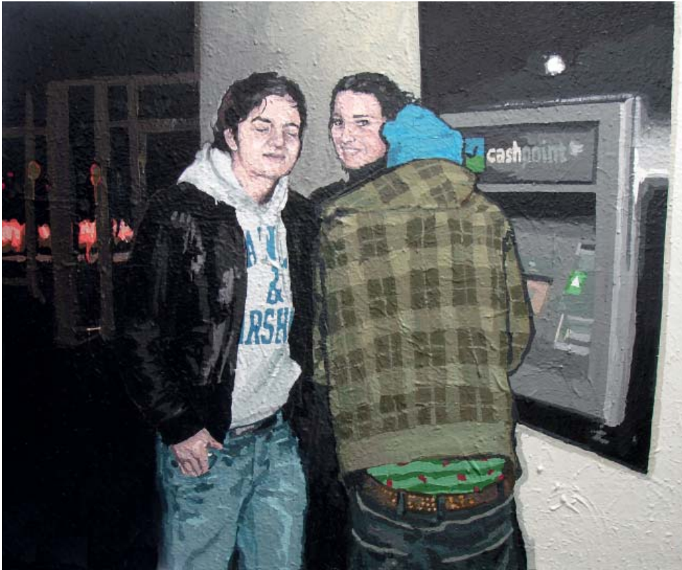
„Cashpoint II“ | Acryl und Acryllack auf Leinwand, 90x110cm, 2011