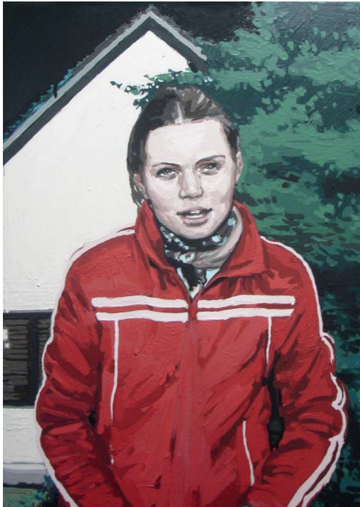
„Nighthawk X“ | Acryl und Acryllack auf Leinwand, 70×50cm, 2011